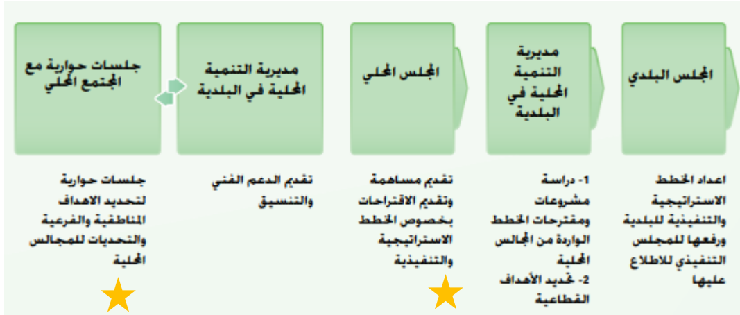
الصورة 2: الخطط الاستراتيجية والتنفيذية للبلديات