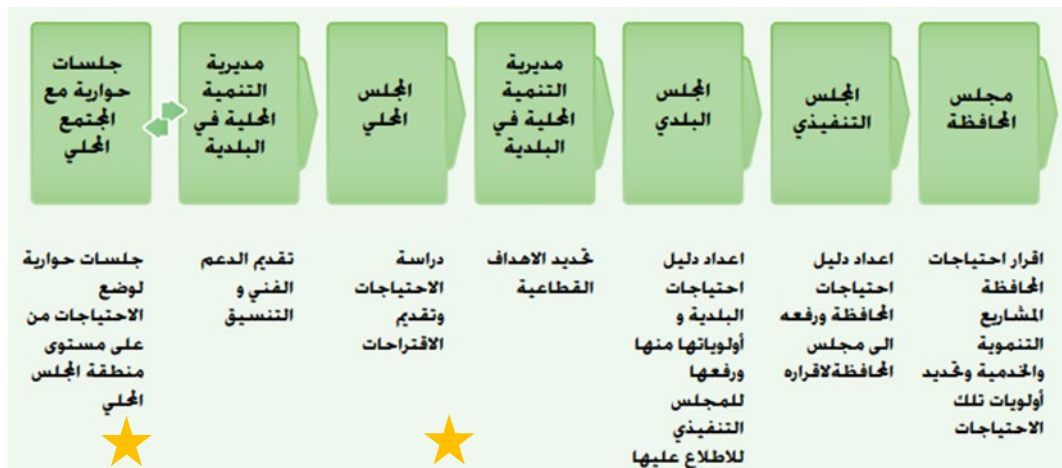
الصورة 1: مسار إعداد دليل الاحتياجات بمشاركة المواطنين

ملاحظة: أدناه تم تحديد المراحل التي يقترح النموذج دور للشباب فيها في العمل المحلي والبلدي (علامة النجمة لتحديد المرحلة بالضبط).